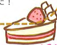
おたんぱうび おめでとう