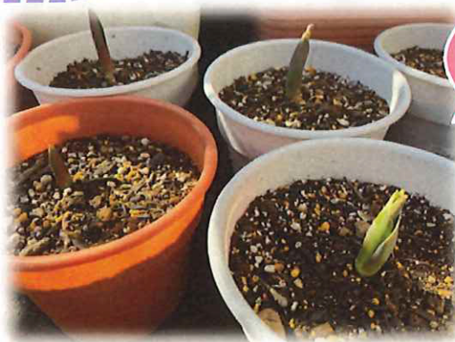
なのはなさん の チューリップ