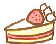
おたんじょうび おめでとう